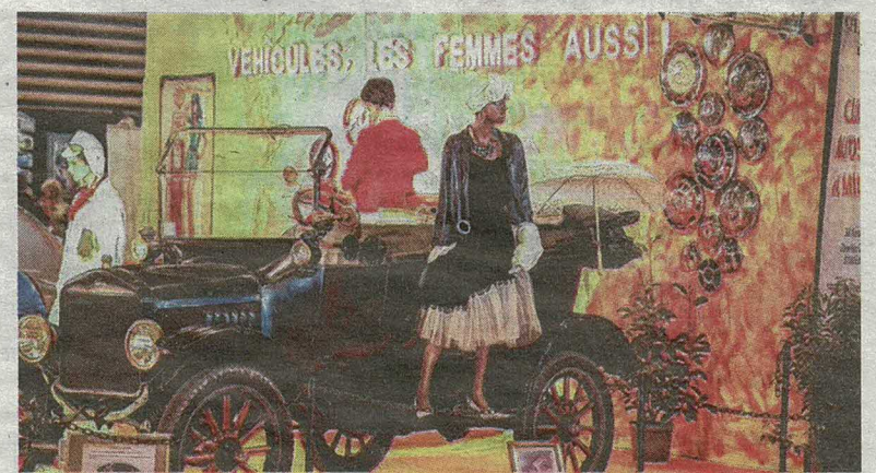
Brigitte Bardot, Joséphine Baker, sœur Clotilde dans sa 2CV... Le stand des Belles Champenoises d'époque met à l'honneur cette année les femmes et leur véhicule.