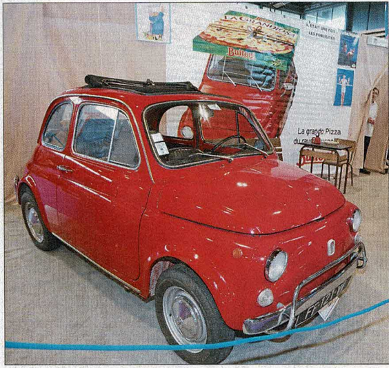
▲ Vous rêvez d'une Fiat 500 L de 1972 qui a suivi le thème de la Publicité ? « Reviens Léon, y a la même à la maison ! »