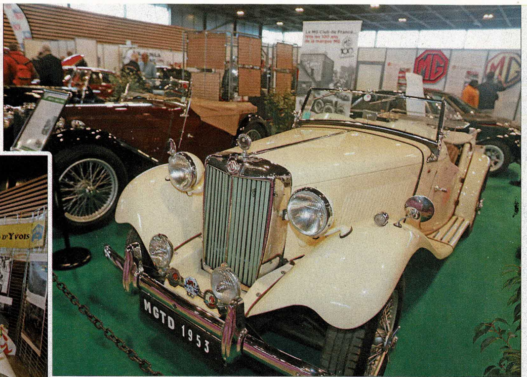
◀ Éric Philbiche en flagrant délit de publicité pour le Grand Prix rétro d'Yvois, qui aura lieu le 2 juin 2024 à Carignan.

Avec la MG TD, ici de 1953, la ligne se modernise et les roues avant sont indépendantes. ►