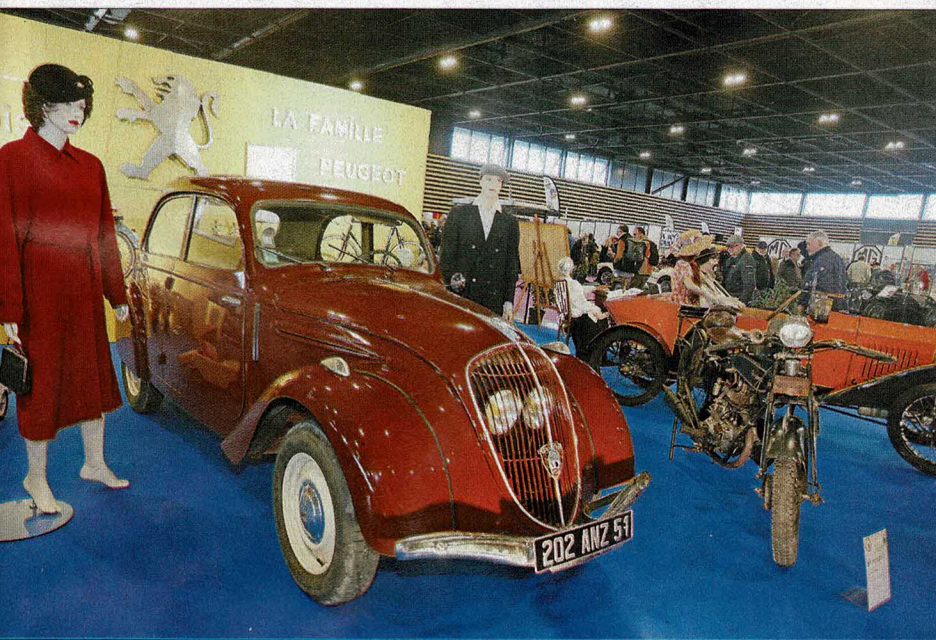
▲ Les Belles champenoises d'époque rendaient hommage au lion avec trois modèles emblématiques de Peugeot : une 404, une 202 et une Quadrillette 172.