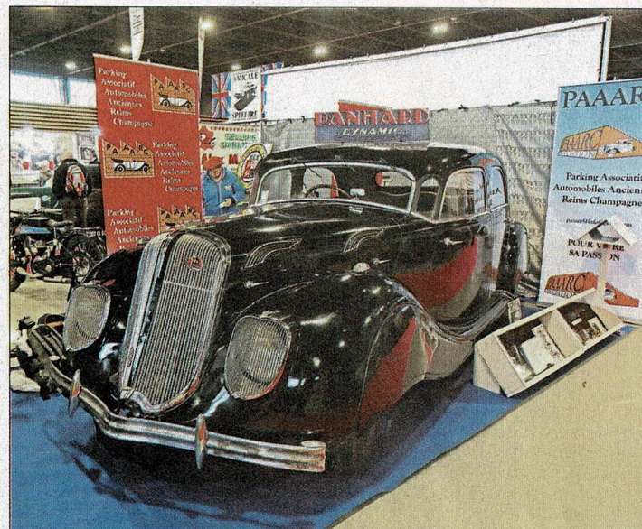
▲ PAAARC Le Parking associatif autos anciennes Reims Champagne misait sur la reine de la route, la Panhard Dynamic.