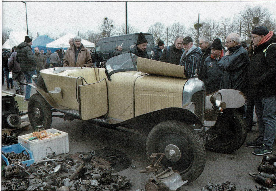
▲ Sur le parking extérieur, une multitude de marchands de pièces. Mais aussi des autos à vendre.