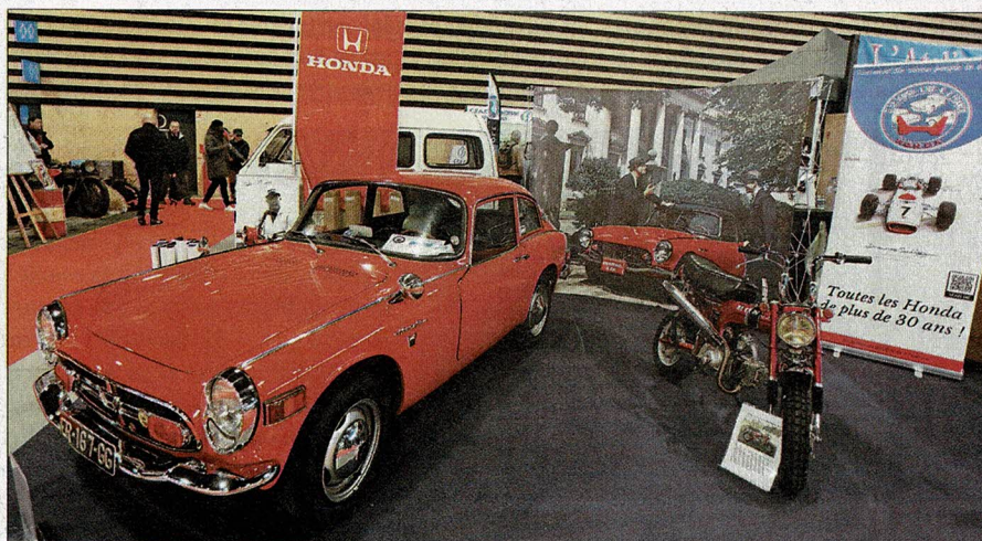
▲ Le coupé Honda S 800 et son diabolique compte-tours qui donne des frayeurs quand on s'y frotte la première fois. Parenté avec la moto oblige, il monte dans les tours, monte, monte...