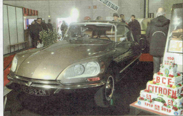
▲ L'évocation du centenaire de la marque Citroën comprenait une douzaine de voitures, dont une DS 23 dans son coloris brun scarabée d'origine.