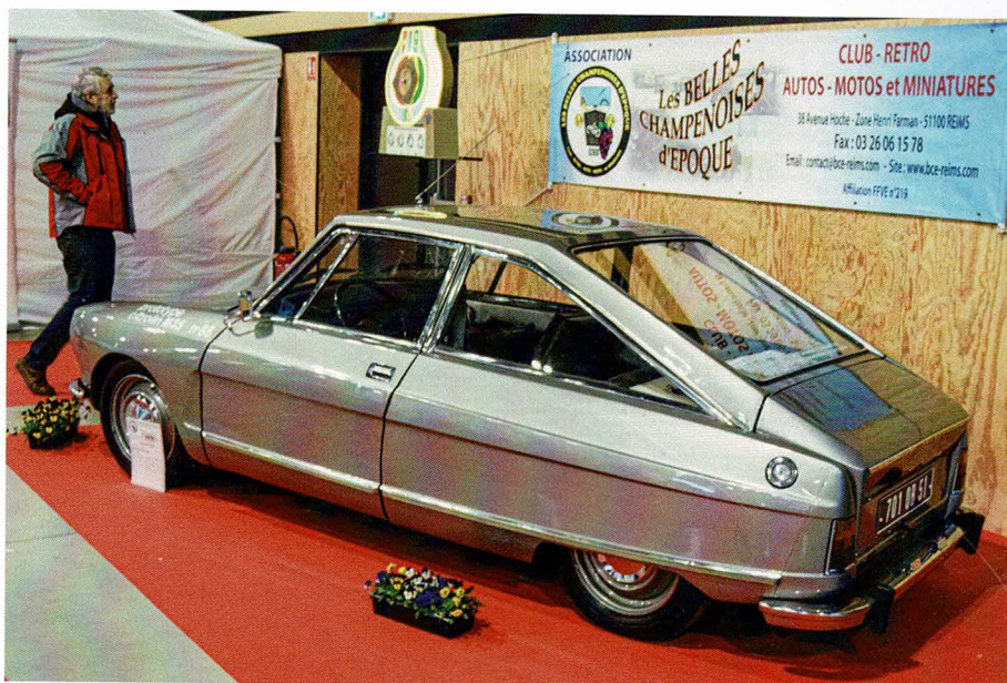
Place au moteur à piston rotatif chez les Belles Champenoises d'Époque pour ce Citroën M 35 exemplaire n° 88 avec suspension hydropneumatique et carrosserie coach spécifique.

35 e SALON CHAMPENOIS DU VÉHICULE DE COLLECTION 4 et 5 mars 2023 Parc des Expositions REIMS Samedi : 8h30-19h00 Dimanche : 9h00-18h00