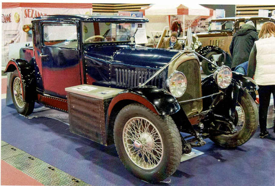
Le club Les Amis de Gabriel Voisin présentait cette rarissime, voire unique, Avions Voisin C 11 Chartapola de 1928, un coupé trois places bien dans l'esprit de la marque.

Prochains rendez-vous ici même pour la 10 e édition de Reims Rétro Pièces les 21 et 22 octobre puis les 9 et 10 mars 2024 pour la 36 e édition du Salon des Belles Champenoises.