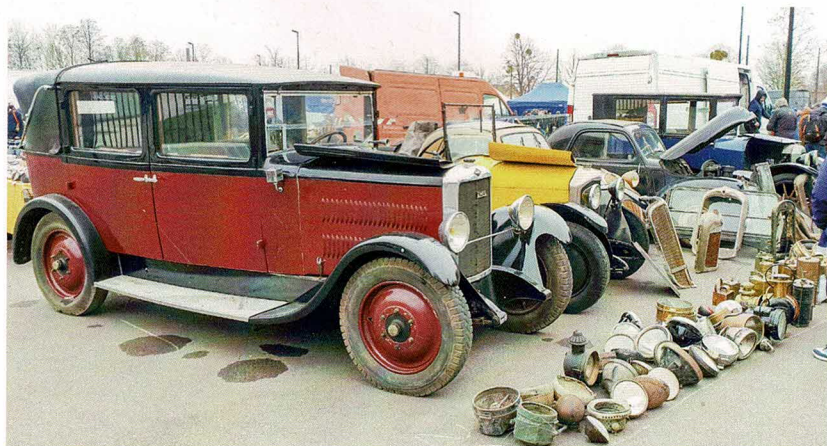
Beaucoup viennent surtout à Reims pour sa bourse d'échanges, organisée tant en intérieur que sur les espaces extérieurs, et où chacun peut parfois trouver de véritables petits trésors.

juin à Epernay, le Gavap Moto propose la France à motos anciennes qui aura lieu fin août, et tant d'autres qui permettent de préparer la nouvelle saison au gré de ses envies. Les clubs présents ont pris l'habitude de décorer leur stand selon le thème proposé par les organisateurs. Cette année, le mot d'ordre est « C'est mémorable ». L'on trouve ainsi les 50 ans de la présentation de la Matra Bagheera