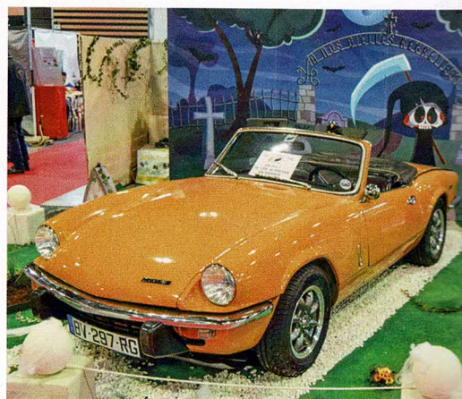
Bravo à l'Amicale Spitfire pour la décoration de son stand selon le thème proposé par les organisateurs.